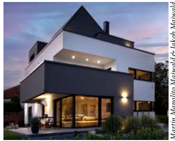
© Martin Manolito Marwald & Jakob Marwald

Seite 6 Architekten: Neugebauer Architekten www.jpn-architekten.de Rohbau: Beichtbau www.beichtbau.de Statik: Martin Schulz www.schulz-tragwerksplanung.de Dachdeckerei: Ernst Neger www.neger.de Fenster: Michael Vogel www.vogel-stuttgart.de Türen: Schreinerei Wingerter www.tischlerei-wingerter.de Leuchten (innen/aussen): Bega www.bega.com SLV www.slv.com Schalter, KNX-Gebäudeauto- mation: Gira www.gira.de Küche/Küchentechnik: Walter Wendel www.walter-wendel.info Armaturen: Herzbach www.herzbach.com Sauna: Saunalux www.saunalux.de